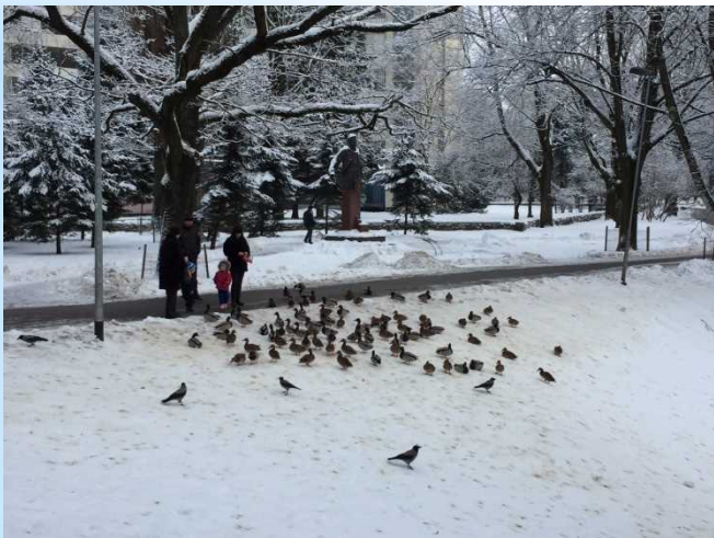
水鳥、すずめ、カラス