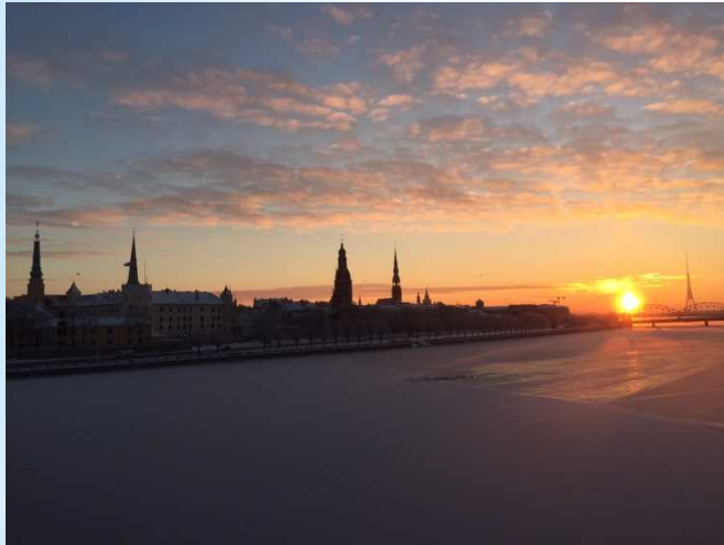
気温マイナス20度の朝