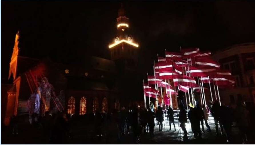
リガ大聖堂（独立記念日）