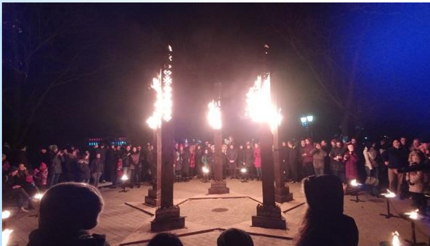
稜堡の丘（独立記念日）